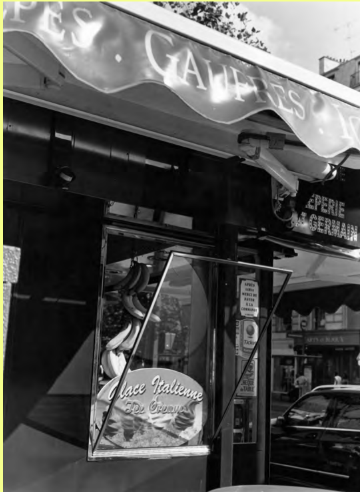
Thomas Bovin, Saint-Germain-des-Près, 2018