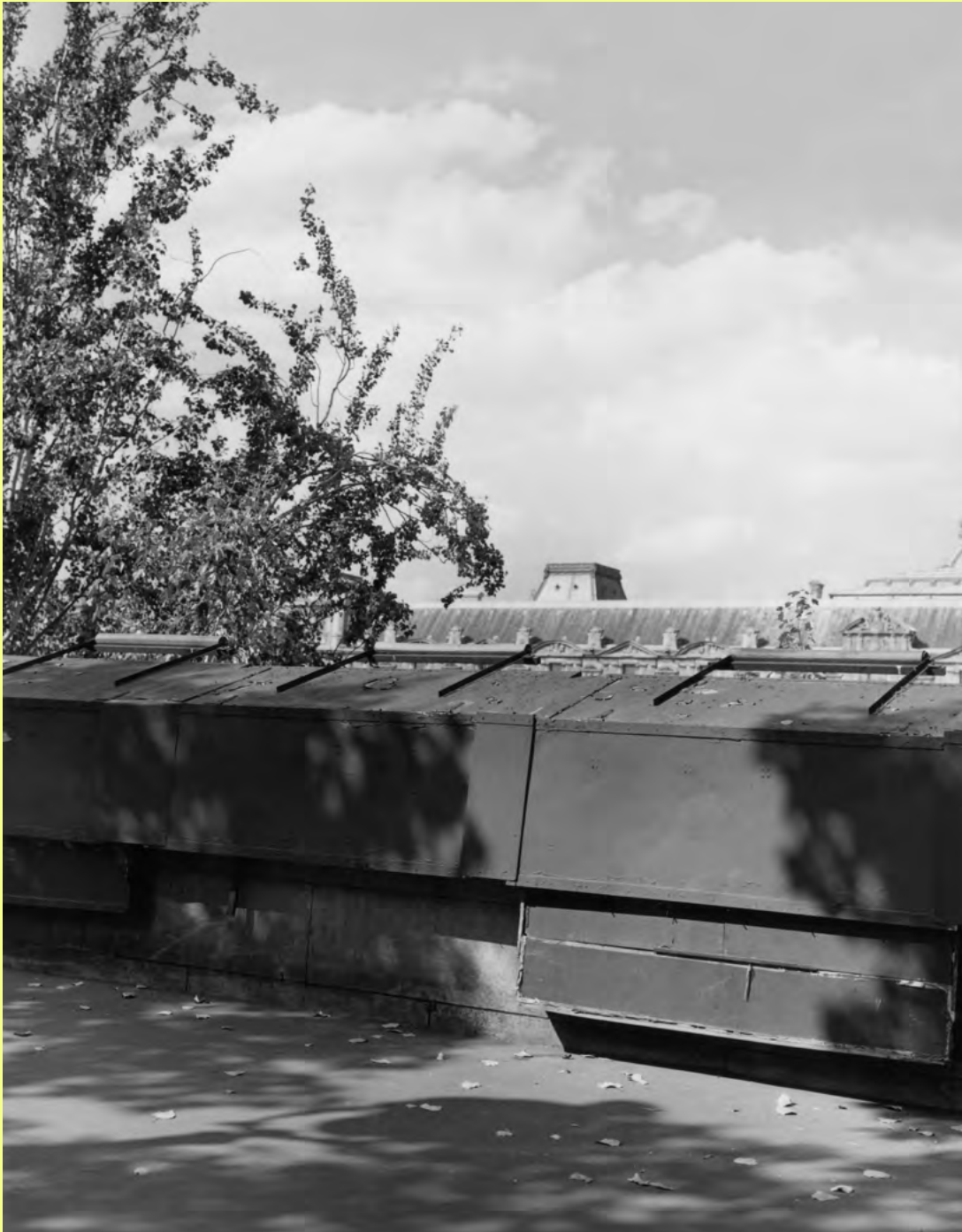
Photo Saint Germain Le parcours photo de la rive gauche 7-24 novembre 2018